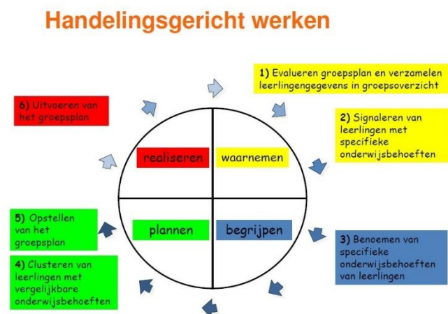
Fig. 2 Schema HGW

(Pameijer, Van Beukering & De Lange, 2009). Het benoemen van wat een leerling nodig heeft, noemen we een onderwijsbehoefte. Het is datgene wat een leerling nodig heeft om een bepaald doel te bereiken.